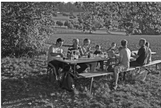
Stimmungsbild vom Blözenfest 2011

Wir stellen Tische und Bänke auf und freuen uns, wenn auch Du in diesem Jahr wieder den Weg finden wirst.