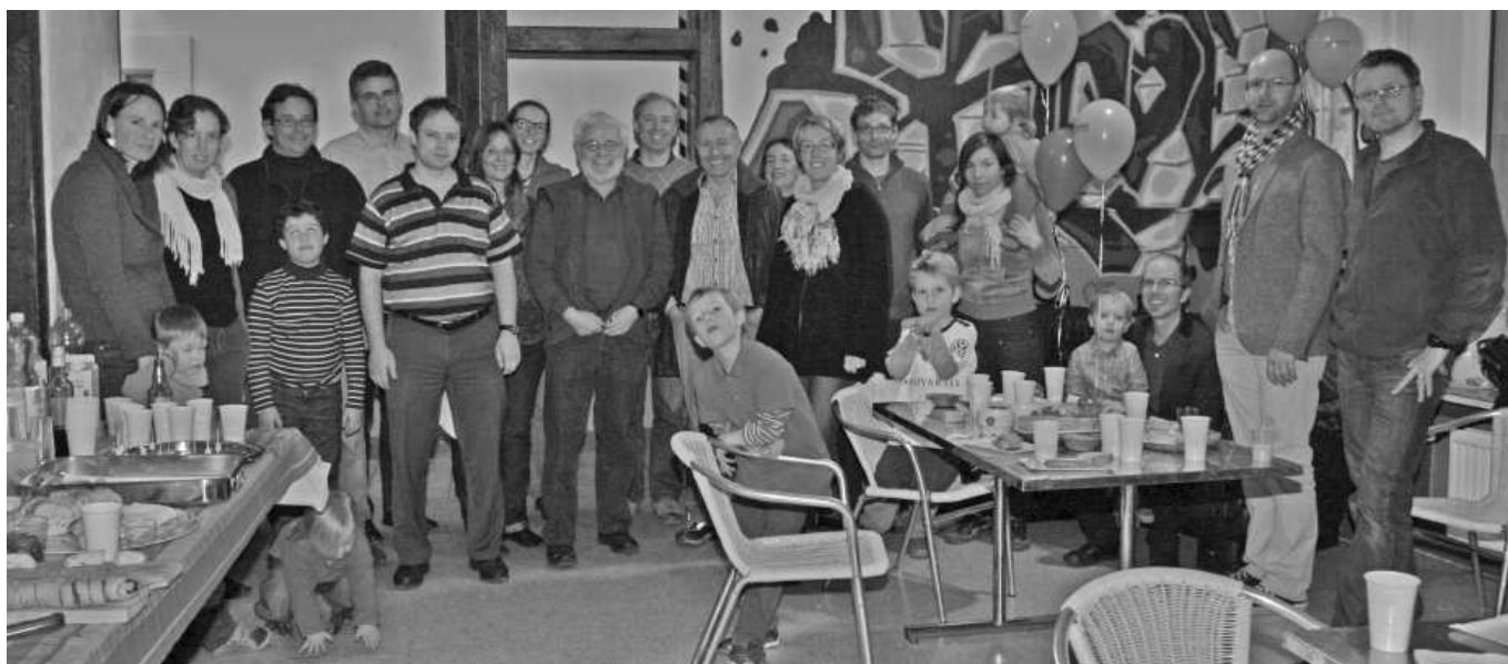
Die Unabhängigen freuen sich am Wahltag über die positiven Resultate